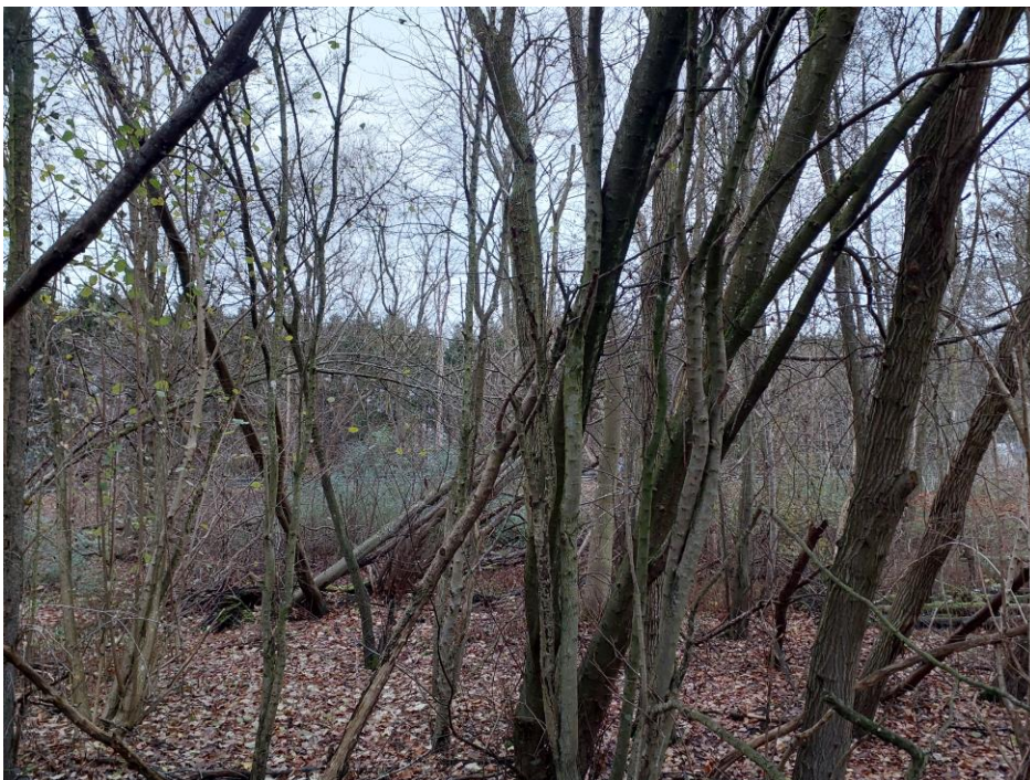
Figur 3. Træer i den nordlige ende af undersøgelsesområdet, hvor der bl.a. står væltede træer.

Generelt er de fleste træer sunde og uden hulheder, som flagermus kan benytte. I den nordlige del af området er der nogle væltede træer med en stammediameter på maksimalt 25-30 cm og uden hulheder mv., der gør dem egnede for flagermus (Figur 3).