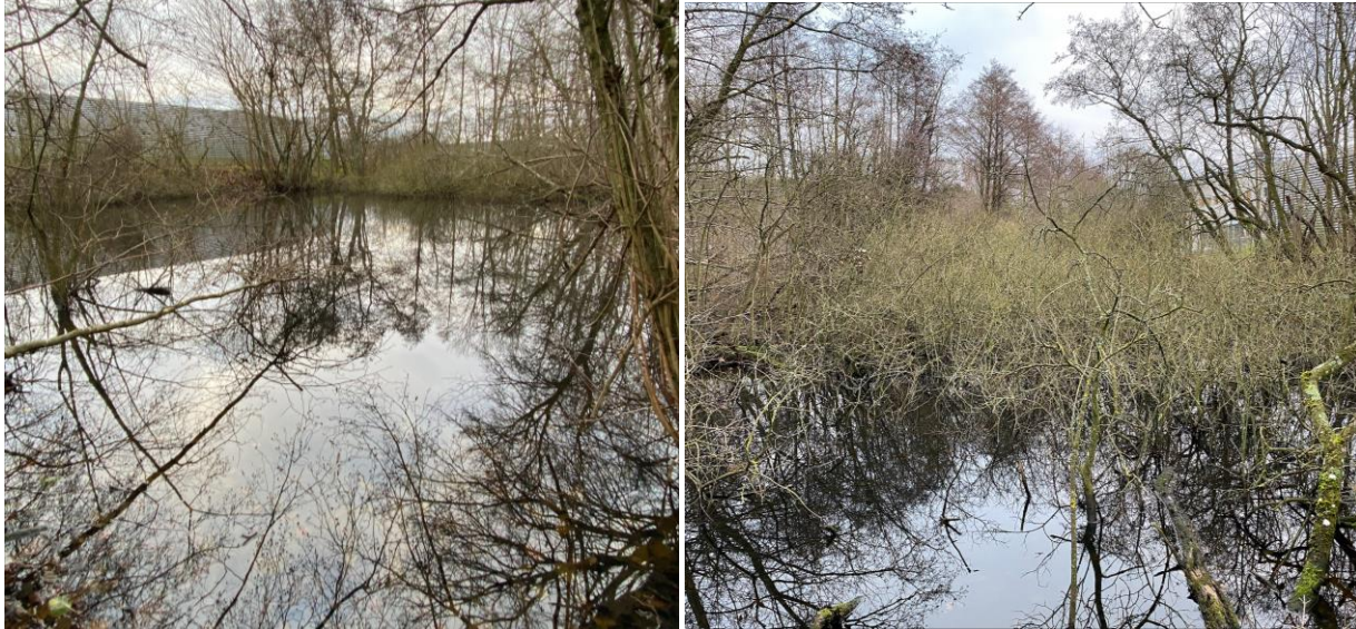
Figur 8. Den §3 beskyttede sø set fra den nordvestlige (tv.) og sydlige bred (th).

plante- og dyreliv. Det skyggende forhold gør desuden, at søen ikke vurderes egnet som ynglevandhul for padder.