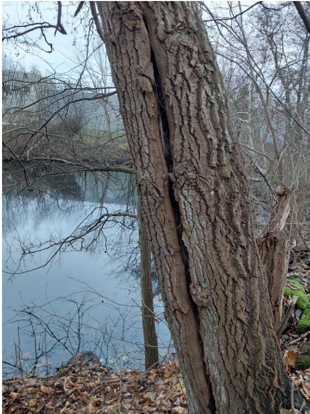
Figur 7. Det meget egnede træ med en flækket stamme.

Det meget egnede træ har en diameter på omkring 40 cm. Stammen er flækket i midten fra jorden og op til omkring 2 meters højde, og det er muligt, at det går endnu højere op (Figur 7). Der er dermed gode muligheder for, at flagermus kan gemme sig inde i stammen i læ for vejr og eventuelle rovdyr. Træet vurderes at være egnet som raste- og ynglested for flagermus, men er for lille til at kunne fungere som vinterkvarter.