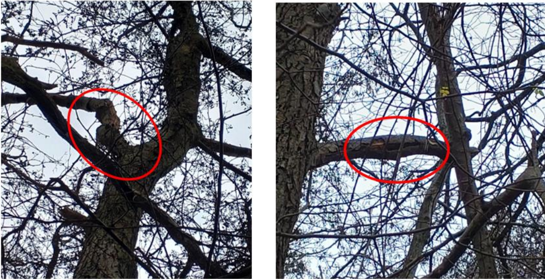
Figur 5. De to lidt egnede træer i undersøgelsesområdet. Begge med løs bark angivet med rød cirkel.

Det moderat egnede træ er dødt i toppen hvor der er en større hulhed i stammen (Figur 6). Det kan ikke udelukkes, at der er åbent i toppen, og at det derfor kan regne ned, hvilket gør det mindre egnet for flagermus. Træet vurderes som ovenstående kun at være egnet som raste- og ikke yngle- eller overvintringssted.