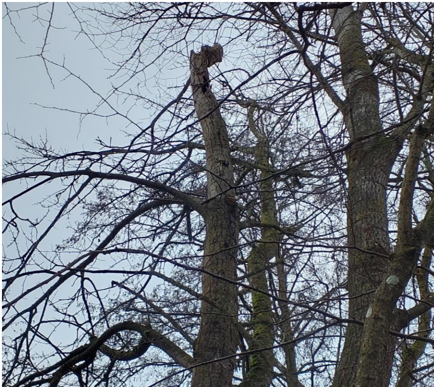
Figur 6. Det moderat egnede træ i undersøgelsesområdet med en større hulhed i toppen.

Det moderat egnede træ er dødt i toppen hvor der er en større hulhed i stammen (Figur 6). Det kan ikke udelukkes, at der er åbent i toppen, og at det derfor kan regne ned, hvilket gør det mindre egnet for flagermus. Træet vurderes som ovenstående kun at være egnet som raste- og ikke yngle- eller overvintringssted.