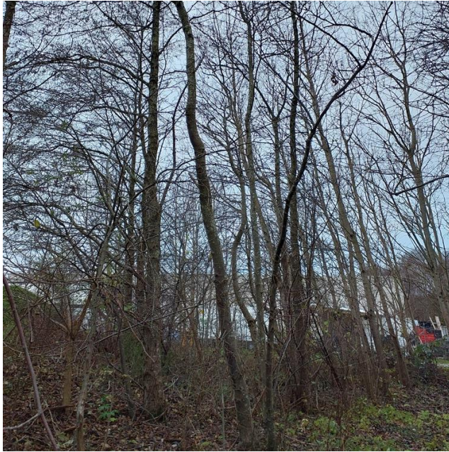
Figur 2. Mindre træer i den sydlige del af området.

Generelt er de fleste træer sunde og uden hulheder, som flagermus kan benytte. I den nordlige del af området er der nogle væltede træer med en stammediameter på maksimalt 25-30 cm og uden hulheder mv., der gør dem egnede for flagermus (Figur 3).